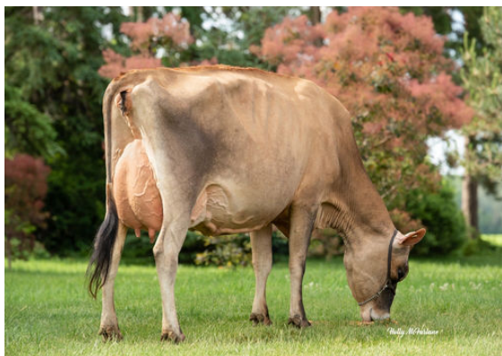
PAULLOR VIRAL MAVORNA

HAWARDEN IMPULS PREMIER ARETHUSA ON TIME VOGUE EX-94-5YR-CAN 3* LENCREST ON TIME HURONIA CENTURION VERONICA 20J EX-97%-5E-USA SOONER CENTURION GENESIS RENAISSANCE VIVIANNE VG-87-2YR-CAN 7*